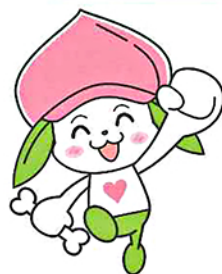
協会けんぽ福島支部マスコットキャラクター ケンタンくん